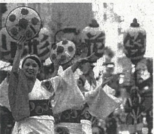
出ており、観客からは早を願う声も聞かれた。