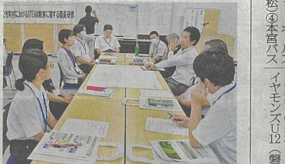
STEAM教育に理解を深める教職員

子どもがSTEAM教育に関する研究センターで開かれ、教職員が効果的な学びの在り方を探った。創造性を育むSTEAM(STEAM)教育に関する研究センターが設定された12市町村の中小学校、義務教育学校、養育教育施設を対象に、県教委と福島イン